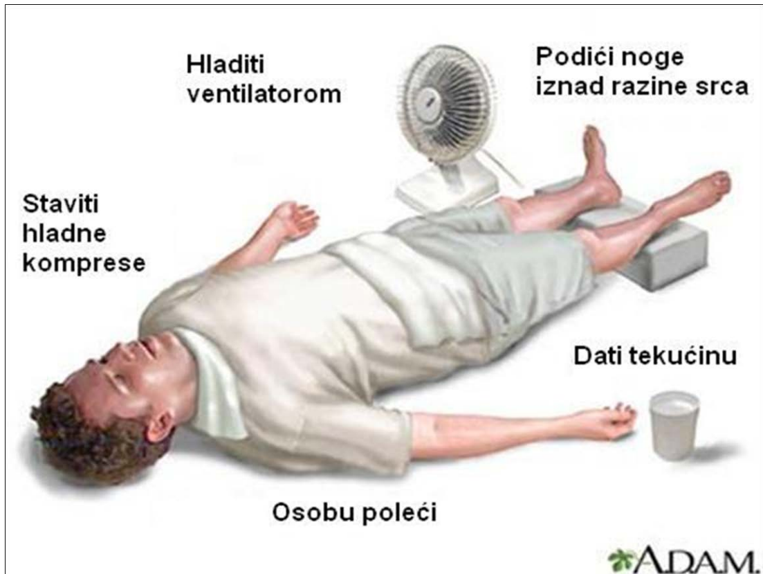
Slika 5. Prikaz pružanja prve pomoć. Rađeno prema A.D.A.M. http://www.adamimages.com/Illustration/Browse/1/H [19]

prostori. Treba ga rashladiti skidanjem odjeće i laganim polijevanjem vodom sobne temperature. Podići mu noge iznad razine srca. Važno je da radnik unosi što više tekućine ako je pri svijesti. Ako nije pri svijesti, treba ga okrenuti u bočni položaj i što hitnije potražiti medicinsku pomoć. [12]