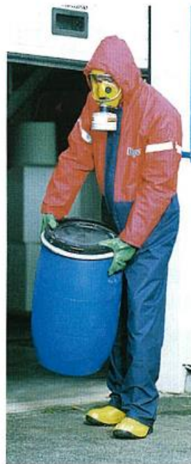
c) odijelo tipa 4