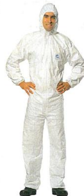
e) odijelo tipa 6