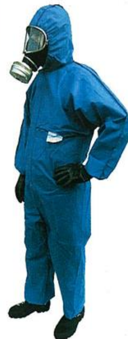
d) odijelo tipa 5