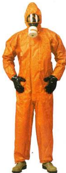
b) odijelo tipa 3