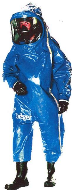
a) Odiijelo tipa 1